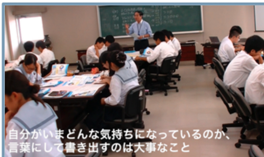
自分がいまだどんな気持ちになっているのか、言葉にして書き出すのは大事なこと