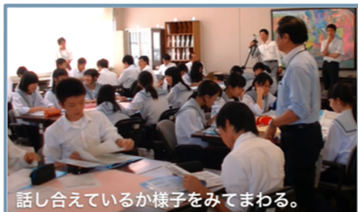
話し合っているか様子を見てまわる。