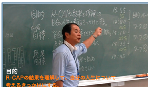
目的とルール説明 (目的 ⇒ 内容目標 ⇒ 態度目標 ⇒ 重要なお願い)