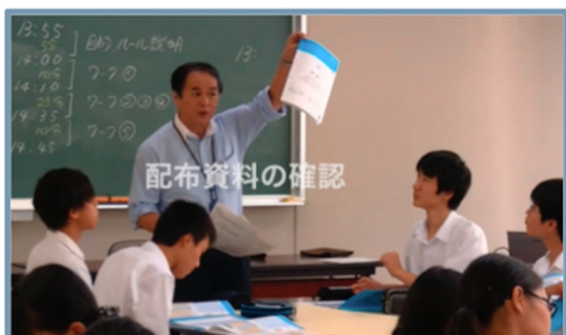
配布資料の確認 (結果・ワークシート他)