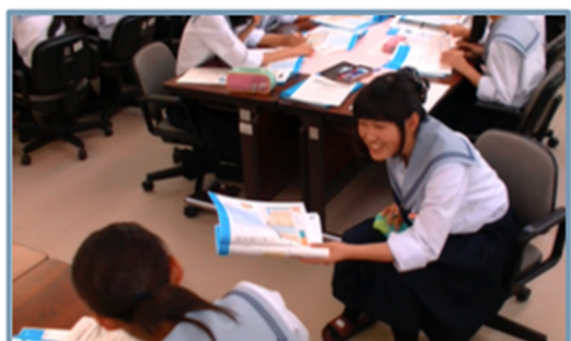
WORK⑤ 感想(振り返り) ※残り10分で振り返りを説明し更に書き進めや話し合いを促す