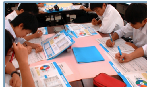
ワークシートに取り組む様子