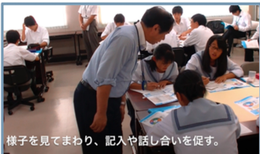
様子を見てまわり、記入や話し合いを促す。