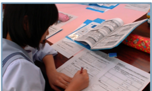
目的とルールに沿って出来ているか都度確認 (時々時間も気にしよう)