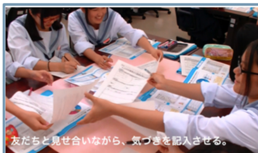
友だちと見せ合いながら、気づきを記入させる。